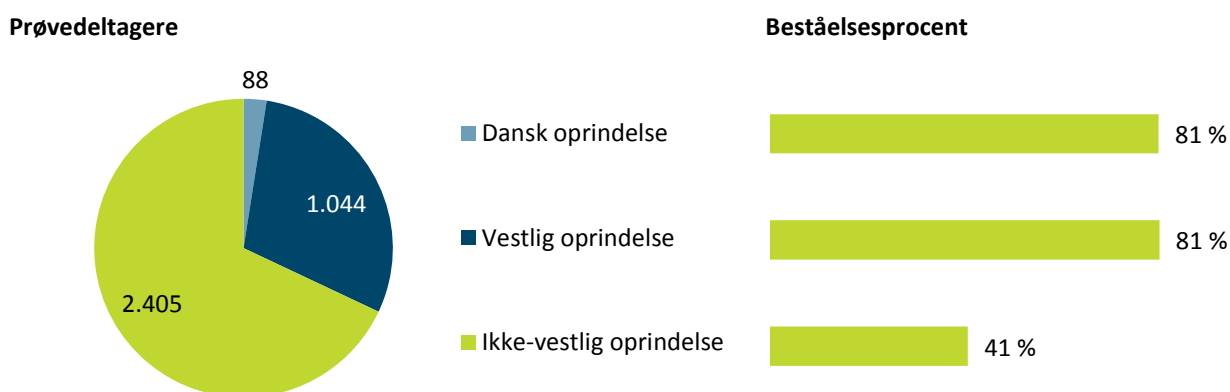
Figur 2: Antal prøvedeltagere og beståelsesprocent fordelt på oprindelse